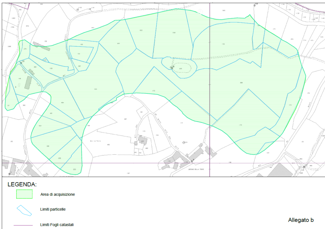
Figura 1 – Planimetria catastale dell'area

Di seguito è riportato uno schema riassuntivo delle particelle afferenti al catasto terreni che saranno oggetto dell'iniziativa espropriativa. Nella figura che segue è riportata una planimetria catastale dove in colore verde è indicata l'area oggetto della stima e dell'esproprio.